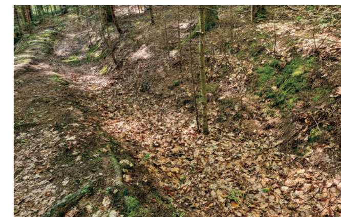
Abb. 15: Alter Wassergraben bei Einberg (Grafenau) mit diversen Stachelingsarten (Foto: 5.9.2021).

Gelegentlich findet man auch mitten in Bauernwäldern Nester von Basenzeigern. Hier lässt sich nicht so leicht ergründen, ob diese Basen natürlichen Ursprungs sind oder von einer länger zurück liegenden Bewirtschaftung stammen. Da Gneise unterschiedliche Gehalte an Calciumoxid aufweisen, kann an Waldstandorten aber meist von einer basischen Verwitterung ausgegangen werden (vgl. KNOCH 1995). An solchen Stellen kann man dann leicht ein Dutzend interessanter Pilzarten wie z. B. Ziegenfußporling ( Albatrellus pes-caprae ), Schafporling ( Albatrellus ovinus ), Violetter Weißsporstacheling ( Bankera violascens ), Nadelwald-Anhängselröhrling ( Butyriboletus appendiculatus ), Zungen-Herkuleskeule ( Clavariadelphus ligula ), Taubenblauer Schleimkopf ( Cortinarius cumatilis ), Sägeblättriger Klumpfuß ( Cortinarius multiformis ), Semmelgelber Schleimkopf ( Cortinarius varius ), Orangegelber Korkstacheling ( Hydnellum aurantiacum ), Zusammenfließender Korkstacheling ( Hydnellum concrescens ), Schwarzer Duftstacheling ( Phellodon niger ), Goldgelbe Gebirgskoralle ( Ramaria largentii ) und Habichtspilz ( Sarcodon imbricatus ) auf wenigen 100 m 2 finden. In dieser Aufzählung finden sich auch mehr oder weniger acidophile Arten (z. B. Albatrellus , Bankera ), da diese häufig gemeinsam an solchen Hotspots beobachtet werden.