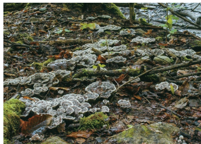
Abb. 12: Phellodon connatus , der Schwarzweiße Duftstacheling, am Innufer bei Passau (Foto: 16.8.2014).