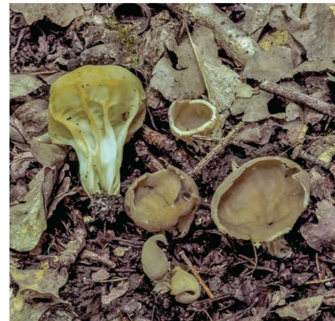
Abb. 4: Auch für die Hochgerippte Becherlorchel ist Rathsmannsdorf der östlichste bekannte Standort (Foto: 27.5.2016).