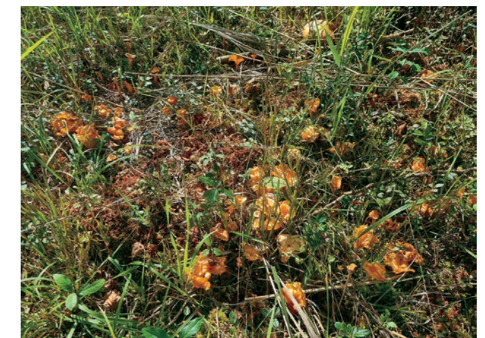
Abb. 6: Ein üppiges Vorkommen des Duftenden Leistlings findet sich im basenreichen Schuttholzmoor (Foto: 12.9.2021).