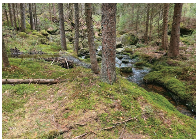
Abb. 9: Wuchsort von Pseudoplectania nigrella am Kleinen Arbersee (Foto: 6.5.2021).