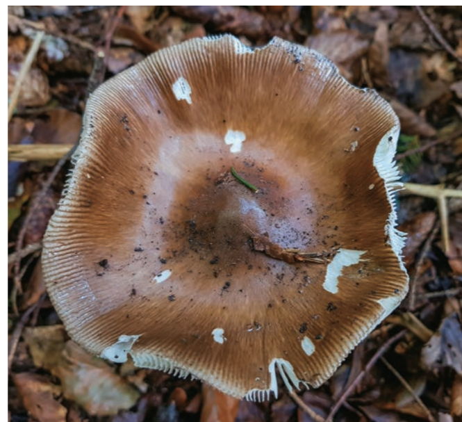
Abb. 19: Amanita spadicea findet man selten und nur auf krautreichen, frischen Böden (Foto: 1.10.2020).

Rotbraune Trüffel (Abb. 20 und 21). Sie gilt als die am weitesten verbreitete Echte Trüffel. Das liegt sicher an ihren geringen Bodenansprüchen. Sie gilt gemeinhin als bodenvag. Schaut man aber im Böhmerwald bei den mehr als 30 bekannten Wuchsorten genauer hin, so sind diese stets an Wegrändern, in der Nähe von Bauwerken oder an auf andere Weise anthropogen beeinflussten Stellen zu finden. Kein einziger davon liegt mitten im Wald, wie es in Kalkgebieten üblich ist. Weitere Basenzeiger an Schuttplätzen in Bauernwäldern und an Forststraßenrändern sind das Kuhmaul ( Gomphidius glutinosus ), der Fichtenreizker ( Lactarius deterrimus ) und der Weiße Büschelrasling ( Leucocybe connata , Abb. 22).