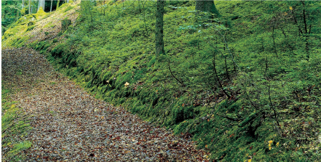
Abb. 17: Artenreiche Wegrandböschung mit Korallen bei Saldenburg (Foto: 21.9.2016).

als acidophil gelten. Man muss sehr viel Glück haben und viele dieser krautreichen Waldstellen besuchen, um den Braunen Riesenstreifling ( Amanita spadicea , Abb. 19) zu finden. Der Böhmerwald scheint aber ein Schwerpunktorkommen dieser in Deutschland nur weniger als sechsmal dokumentierten Art zu sein.