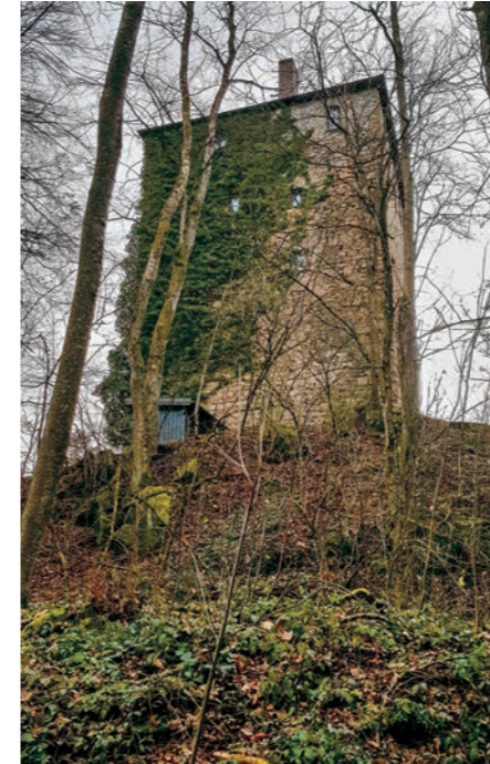
Abb. 20: Eine schuttreiche Böschung bei Burg Kaltenstein ist ein typischer Wuchsort der Rotbraunen Trüffel (Foto: 19.12.2019).