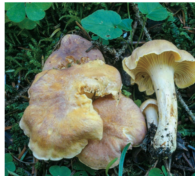
Abb. 18: Amethystpfifferlinge in einem krautreichen Bauernwald bei Schönberg (Foto: 8.8.2014).

Wenn wir unter die Erde blicken, dann gelten die Echten Trüffel (Gattung Tuber ) als wärme- und kalkliebend. Daher findet man ältere Nachweise dieser Gattung im Böhmerwald nur sehr selten. Mit einer genaueren Standortkunde und gezielter Suche konnten aber in den letzten sieben Jahren zehn Arten von Echten Trüffeln nachgewiesen werden. Die häufigste davon ist Tuber rufum , die