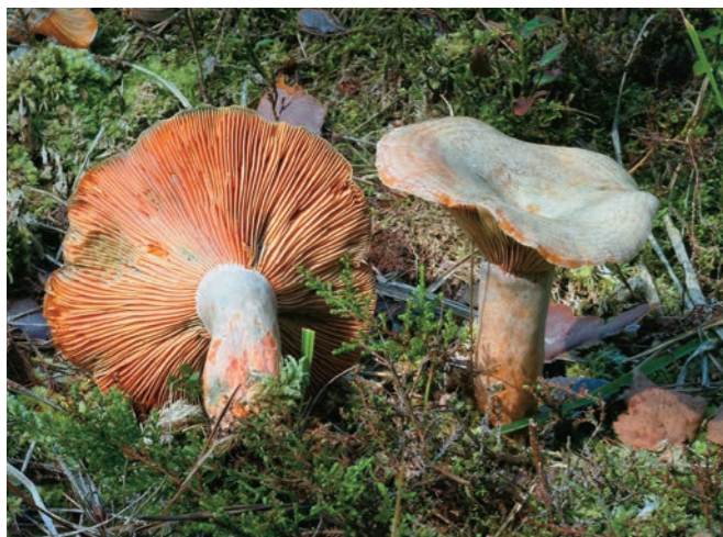
Abb. 8: Der Braune Kiefern-Blutreizker wurde im basenreichen NSG Schuttholzmoor erstmals im bayerischen Teil des Böhmerwaldes nachgewiesen (Foto: 12.9.2021).