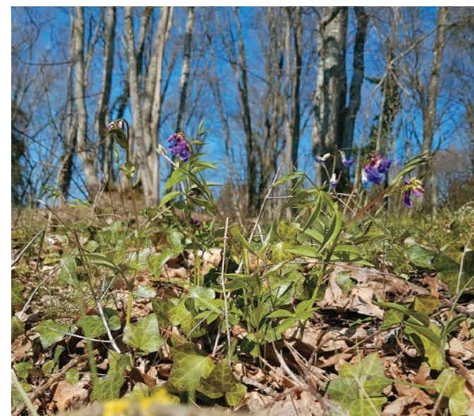
Abb. 1: Frühlings-Platterbsen finden sich im Kalkfeld bei Rathsmannsdorf (Foto: 1.4.2020; alle Fotos vom Verfasser).

Mit der Veröffentlichung der Webseite www.pilze-ohne-grenzen.eu liegt seit Mitte 2020 erstmals eine grenzübergreifende Gesamtübersicht über die Pilzvorkommen im Böhmerwald vor. Das Inventar zwischen Mühl- und Waldviertel im Süden und der Waldnaab im Norden beträgt derzeit mehr als 4.200 Pilzarten. Mit der vorliegenden Gesamtübersicht ist nun erstmals eine gemeinsame Grundlage vorhanden, auf der die nach wie vor im Vergleich zur Vegetation nur rudimentären Kenntnisse der Funga ausgebaut werden können. Bekanntermaßen sind basenreiche Biotope in Deutschland im Mittel artenreicher als basenarme. Wo an dunklen Waldstandorten die schütterere Vegetation kaum Rückschlüsse auf die Bodenwerte zulässt, sind Pilze als umweltsensible Organismen wertvolle Zeigerarten (vgl. KNOCH 1995). Nach basiphilen und neutrophilen Pilzarten kann man gezielt an Orten Ausschau halten, an denen die floristische Kartierung Pflanzen als Basenzeiger aufweist. Sofern der Erhaltungszustand der Vegetation gut ist, können so neue Hotspots der Artenvielfalt entdeckt werden und nicht selten Neufunde für das Böhmerwaldareal entdeckt werden.