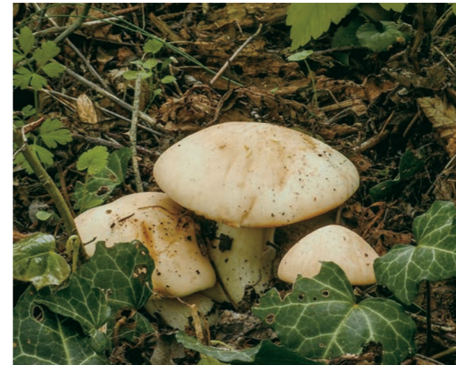
Abb. 2: Calocybe gambosa , der Maipilz oder Georsgritterling, ist ein Basenzeiger.

Kleinräumige, natürliche Basenanreicherungen finden sich im gesamten Gebiet verstreut, vorzugsweise an Gewässerrändern im Überflutungsbereich. Sehr schön beobachten kann man die Präferenz dieser Standorte bei Pseudoplectania nigrella , dem Ungestielten Schwarzborstling (Abb. 9 und 10). Während dieser Frühlingspilz im Alpenvorland beispielsweise bei München an vielen beliebigen Wuchsstellen in Fichtenforsten zu finden ist, stammen alle Nachweise im Böhmerwald ausschließlich von Uferstreifen an Fließgewässern (Abb. 11). Gefunden werden kann die Art je nach Witterungsverlauf und Höhenlage ab Mitte April bis Anfang Juni. Je weiter man sich vom Ufer entfernt, umso unwahrscheinlicher bzw. aussichtsloser ist es, Fruchtkörper zu finden. Auch die selten gewordenen Stachelinge findet man am ehesten entlang von naturbelassenen Uferstreifen. Drei bekannte Standorte vom Schwarzweißen Duftstacheling ( Phellodon connatus , Abb. 12), stammen vom Innufer bei Passau, Regenufer bei Bayerisch Eisenstein und Schwarzachufer bei Spiegelau.