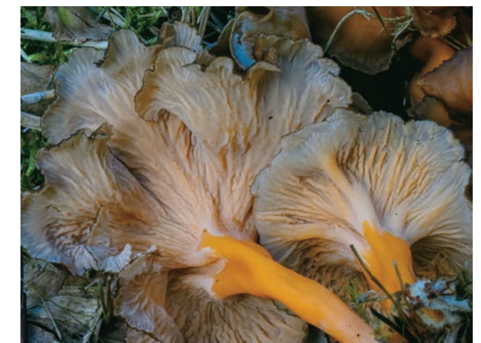
Abb. 7: Duftender Leistling.