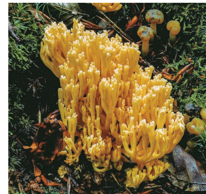
Abb. 16: Ramaria pallidosaponaria ist eine der seltenen großen Korallenarten, die man im Böhmerwald antreffen kann (Foto: 21.9.2016).

Die traditionsreiche Siedlungsgeschichte im Böhmerwald hat von den ersten Wehrburgen über Schlossanlagen, Triftkanäle, Wassergräben (Abb. 15) bis hin zu einem umfangreichen Straßen- und Wegenetz unzählige kleinräumige Nischen geschaffen, an denen die ursprünglich sauren Böden mit Basen angereichert wurden. Wenn an Wegrandböschungen die wunderschönen Korallen wie Ramaria pallidosaponaria (Abb. 16) wachsen, ist dies nahezu immer ein Hinweis auf Basen und einen pilzkundlichen Hotspot (Abb. 17). Auch ehemalige Hochäcker kann man in den Wäldern an einer krautreichen Bodenvegetation erkennen. Hier sind z. B. die eher neutrophilen Amethystpfifferlinge ( Cantharellus amethysteus , Abb. 18) zu finden, während die beliebten Eierschwammerl, Trompetenpfifferlinge und Aprikosenpfifferlinge