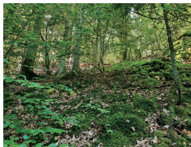
Abb. 13: Herbsttrompeten an einer Wegrandböschung bei Saldenburg (Foto: 4.9.2021).

Zu den neutrophilen Arten kann man sicher die Herbsttrompete ( Craterellus cornucopioides , Abb. 13 u. 14) zählen. Man kann sie im Böhmerwald nur an Quellhängen, Wegrandböschungen und Bachzonen zusammen mit ihrem Mykorrhizapartner, der Rotbuche, antreffen. Dort ist sie dann oft in größerer Anzahl vorhanden, während man in basenarmen Regionen vergeblich nach ihr sucht. Im unteren Donaauraum bei Passau gibt es auch Vorkommen von Herbsttrompeten in Laubmischwäldern mit Eichen (ZECHMANN in litt.). Dies bestätigt Beobachtungen, dass der Kalkbedarf von neutro- und basiphilen Arten in wärmerem Klima deutlich niedriger ist. Südlich der Alpen wächst die Herbsttrompete, wie viele andere in Deutschland als Basenzeiger geltende Pilzarten, auch auf neutralen bis sauren Böden.