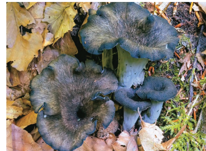
Abb. 14: Craterellus cornucopioides wächst bevorzugt an basenreicheren Wegrändern und Seigen (Foto: 4.9.2021).

Zu den neutrophilen Arten kann man sicher die Herbsttrompete ( Craterellus cornucopioides , Abb. 13 u. 14) zählen. Man kann sie im Böhmerwald nur an Quellhängen, Wegrandböschungen und Bachzonen zusammen mit ihrem Mykorrhizapartner, der Rotbuche, antreffen. Dort ist sie dann oft in größerer Anzahl vorhanden, während man in basenarmen Regionen vergeblich nach ihr sucht. Im unteren Donaauraum bei Passau gibt es auch Vorkommen von Herbsttrompeten in Laubmischwäldern mit Eichen (ZECHMANN in litt.). Dies bestätigt Beobachtungen, dass der Kalkbedarf von neutro- und basiphilen Arten in wärmerem Klima deutlich niedriger ist. Südlich der Alpen wächst die Herbsttrompete, wie viele andere in Deutschland als Basenzeiger geltende Pilzarten, auch auf neutralen bis sauren Böden.