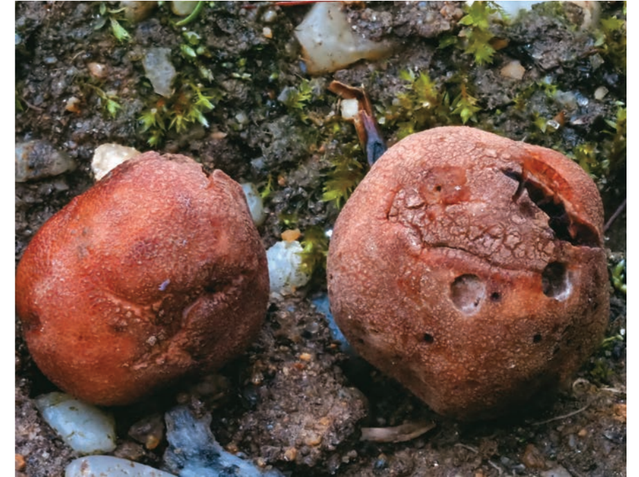
Abb. 21: Tuber rufum ist die im Böhmerwald am weitesten verbreitete, weil anspruchslose Echte Trüffel (Foto: 27.12.2019).