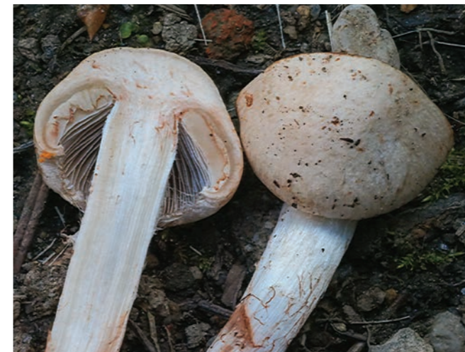
Abb. 3: Zur gleichen Zeit im Frühjahr wie die Maipilze finden sich schon die Rötenden Risspilze (Foto: 1.6.2020).