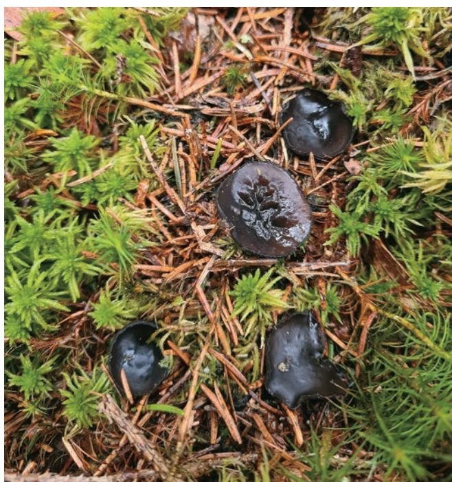
Abb. 10: Fruchtkörper von Pseudoplectania nigrella am Kleinen Arbersee (Foto: 6.5.2021).