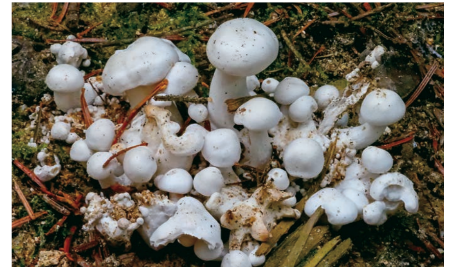
Abb. 22: Weiße Büschelraslinge an Störstelle im Bauernwald bei Einberg (Foto: 26.9.2021).